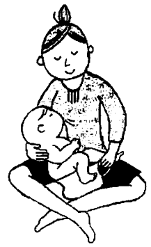
授乳しながらオシッコをキャッチ。 ホーロー製おまるを使うやり方