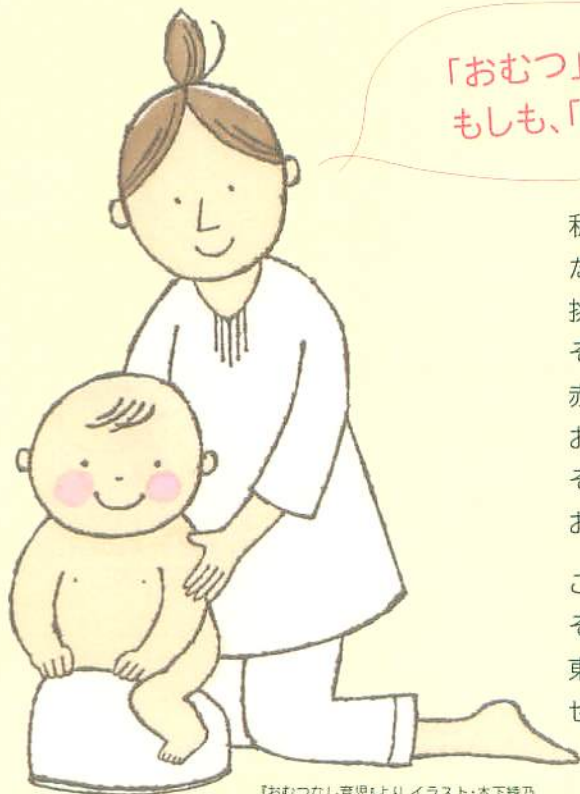
『おむつなし育児』より イラスト・木下織乃

「おむつ」って、いつも、ぜったいに必要なものかな？ もしも、「おむつ」がなくても過ごせるとしたら？